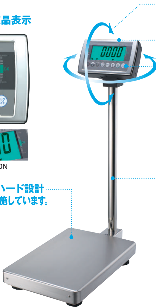
DS-55S-QAS ロングポールタイプ