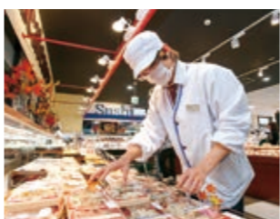
▲一人分に小分けされたものからお弁当まで多彩な惣菜が目の前のオープンキッチンで作られる