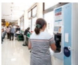
▲入口横に設けられた「ピュアウォーター」も人気サービスのひとつ