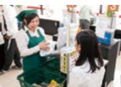
▶作荷台に商品を運びつつ、お客様がスムーズに精算ができているか確認し、必要であれば声掛けを行う