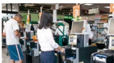
▲茂原緑ヶ丘店には、スキニング機3台と精算機6台に加え、通常のレジも1台用意。スキニング機より精算機が多くあるので、焦らず余裕を持って精算ができる